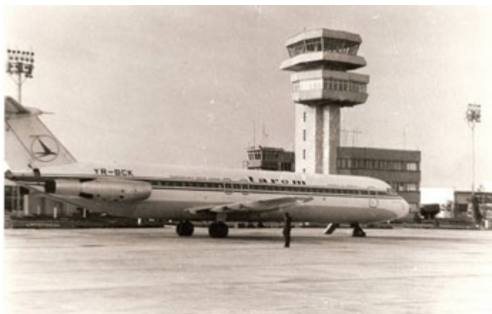
NOIEMBRIE 1980-PRIMA CURSA EXTERNA-FRANKFURT